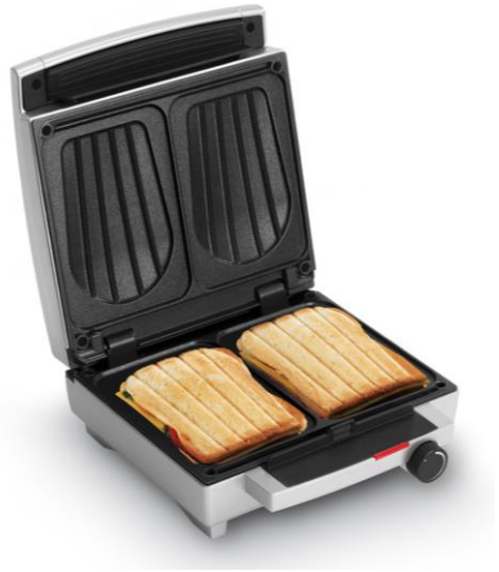
Sandwich Maker SW 1450