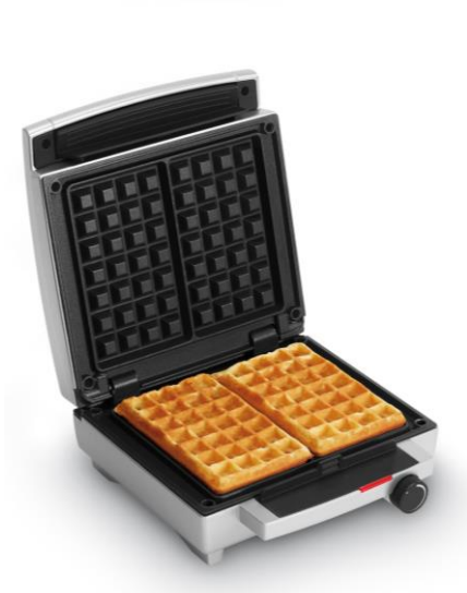
Waffle Maker WA 1450